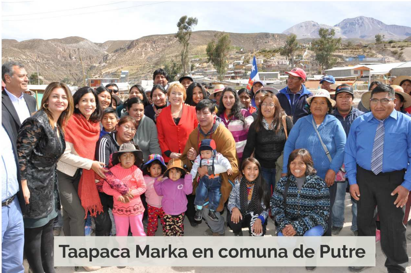
Taapaca Marka en comuna de Putre